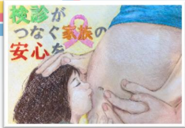
▲第3回 最優秀賞作品

乳がんの早期発見・早期治療には定期的な検診がとても大切です。 いつまでも健康でいてほしいお母さんや家族、友人・地域の人たちに 検診に行ってもらえるよう、乳がん検診の大切を絵に込めて伝えてみませんか？